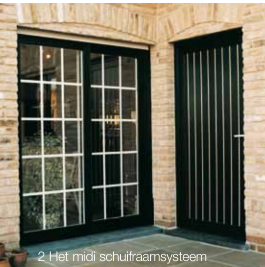
2 Het midi schuifraamsysteem