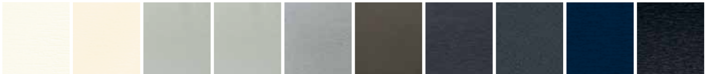
zuiver wit (RAL 9010) roomwit (RAL 9001) agaatgrijs (RAL 7038) betongrijs (RAL 7032) zilvergrijs (RAL 7001) kwartsgrijs (RAL 7039) antracietgrijs (RAL 7016) antracietgrijs gegraneerd (RAL 7016) staalblauw (RAL 5011) monumentenblauw (RAL 5004) enkel voor NL.