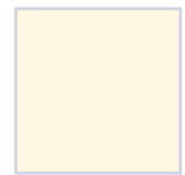
Crème wit (RAL±9001) BC