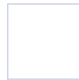
Europees wit (RAL±9016) BE

Twee uitvoeringen zijn mogelijk: Europees wit en crème wit