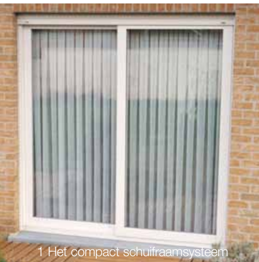
1 Het compact schuifraamsysteem